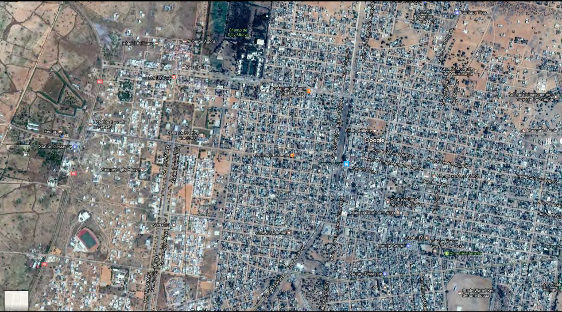
Map of the city of Louga