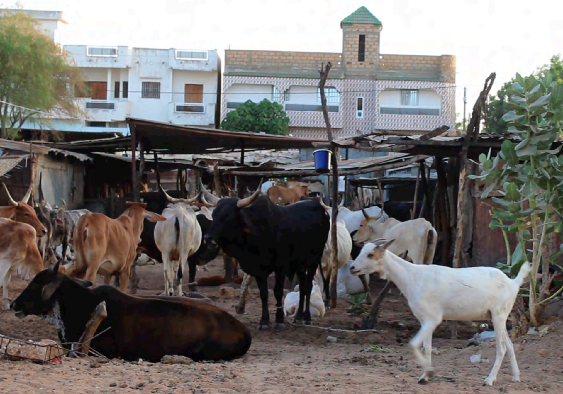
Livestock market at Louga