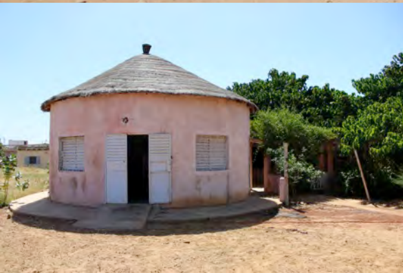
Entrance FESFOP Village and Office FESFOP Administration