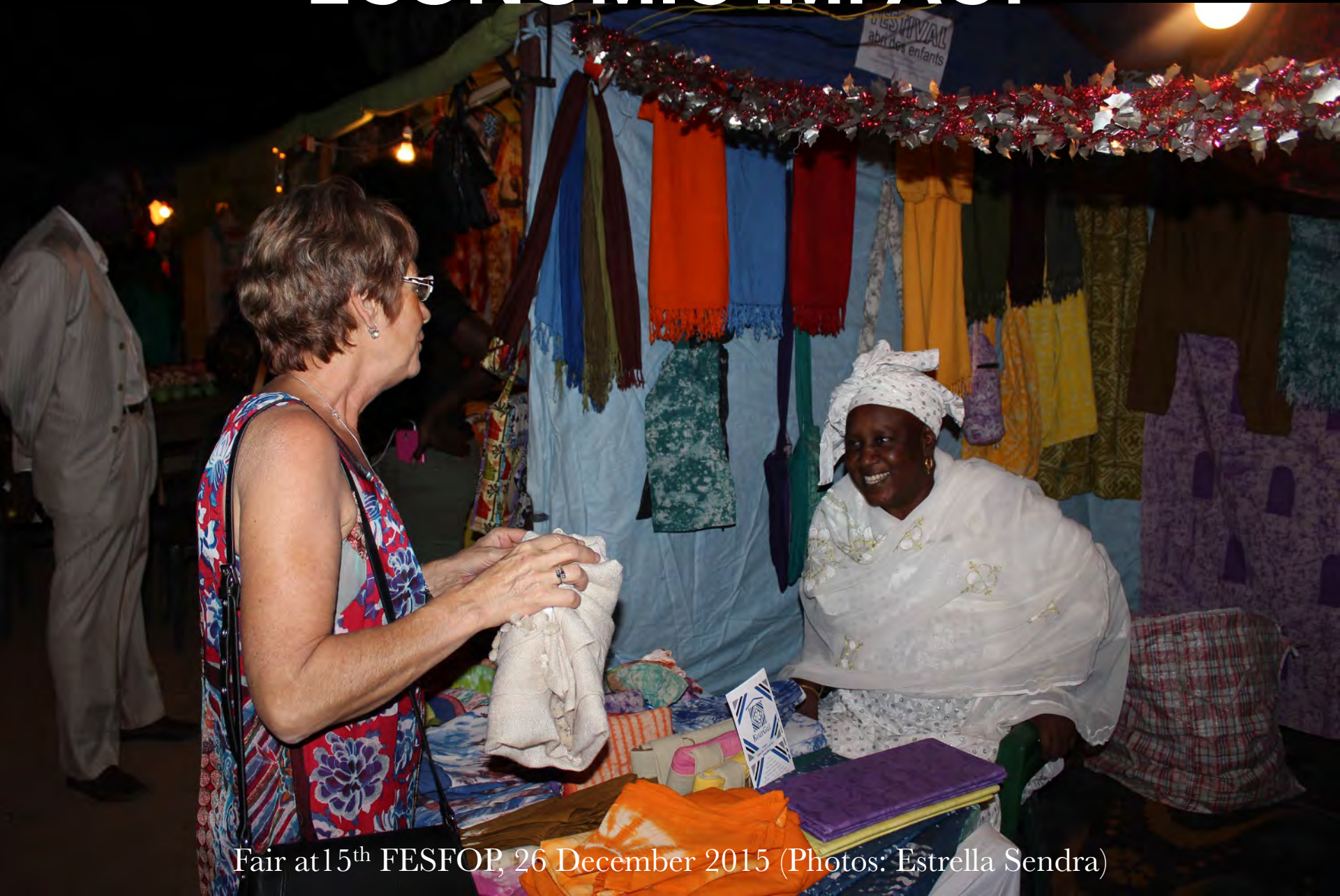
Fair at 15 th FESFOR, 26 December 2015