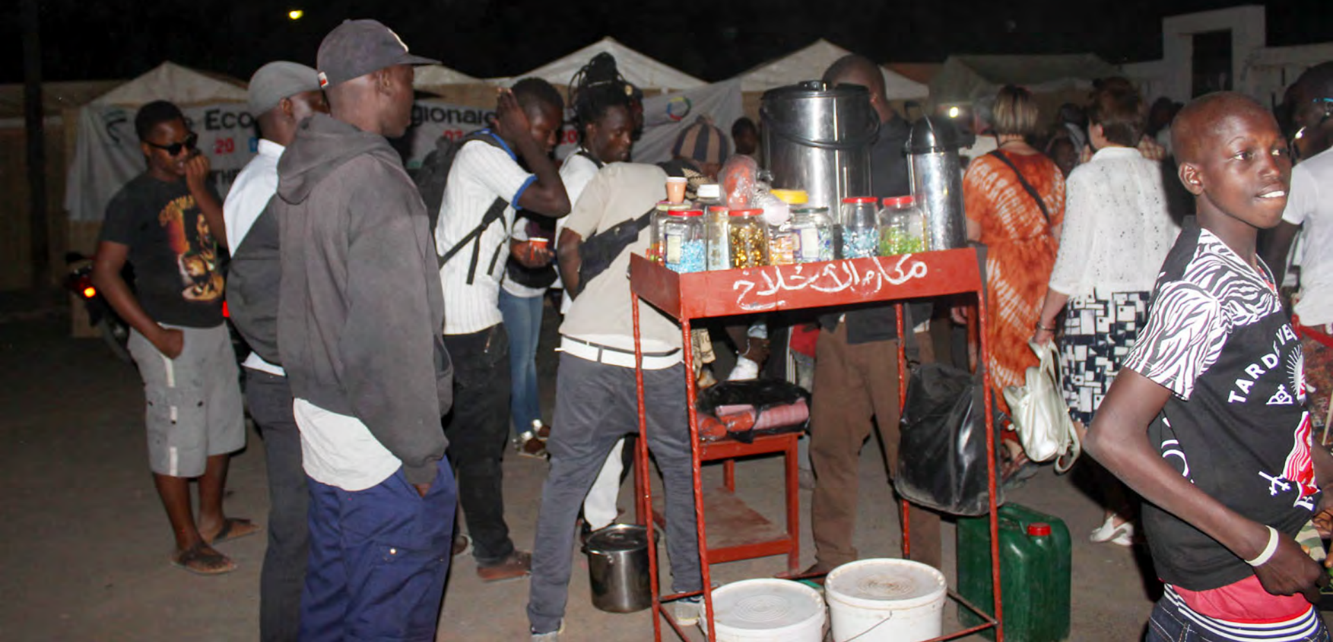
Vendors of Café Touba by the Fair at 15 th FESFOP, 29 December 2015