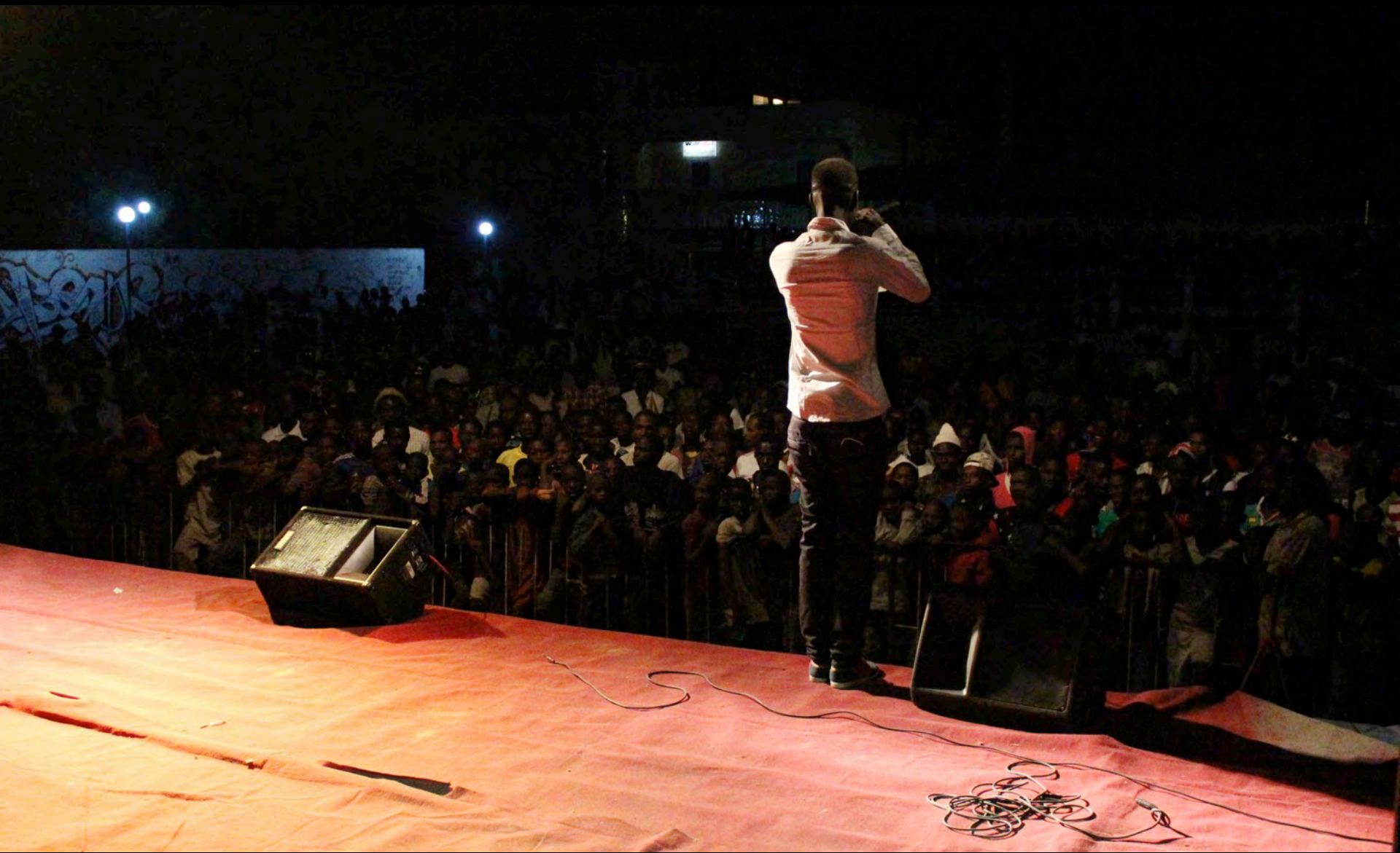
Audiences at opening Festival Njaambuur Hip Hop, 24 December 2015