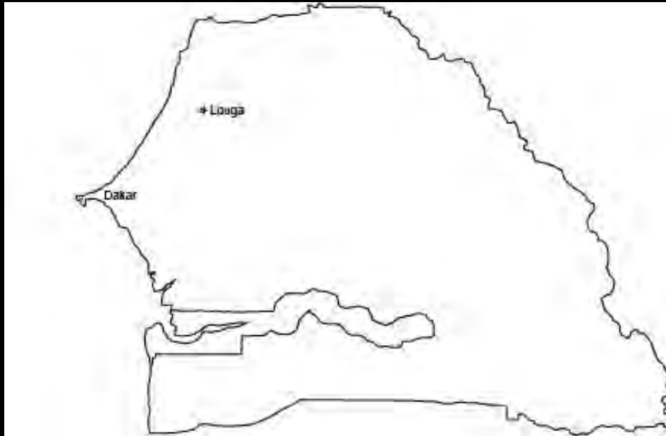
Map of Louga in Senegal