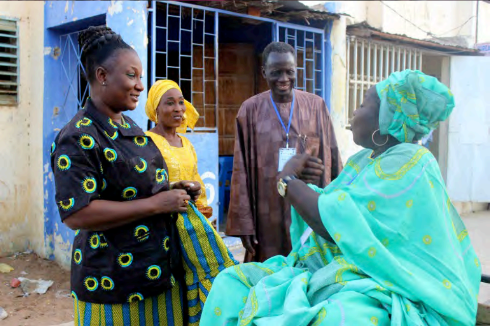
Carnival at 15 th FESFOP, 31 December 2015