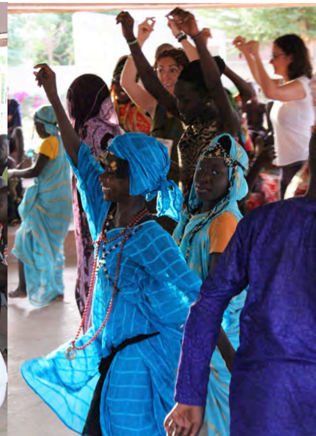
FIRPI performances at Village SOS Enfants, 15 July 2016