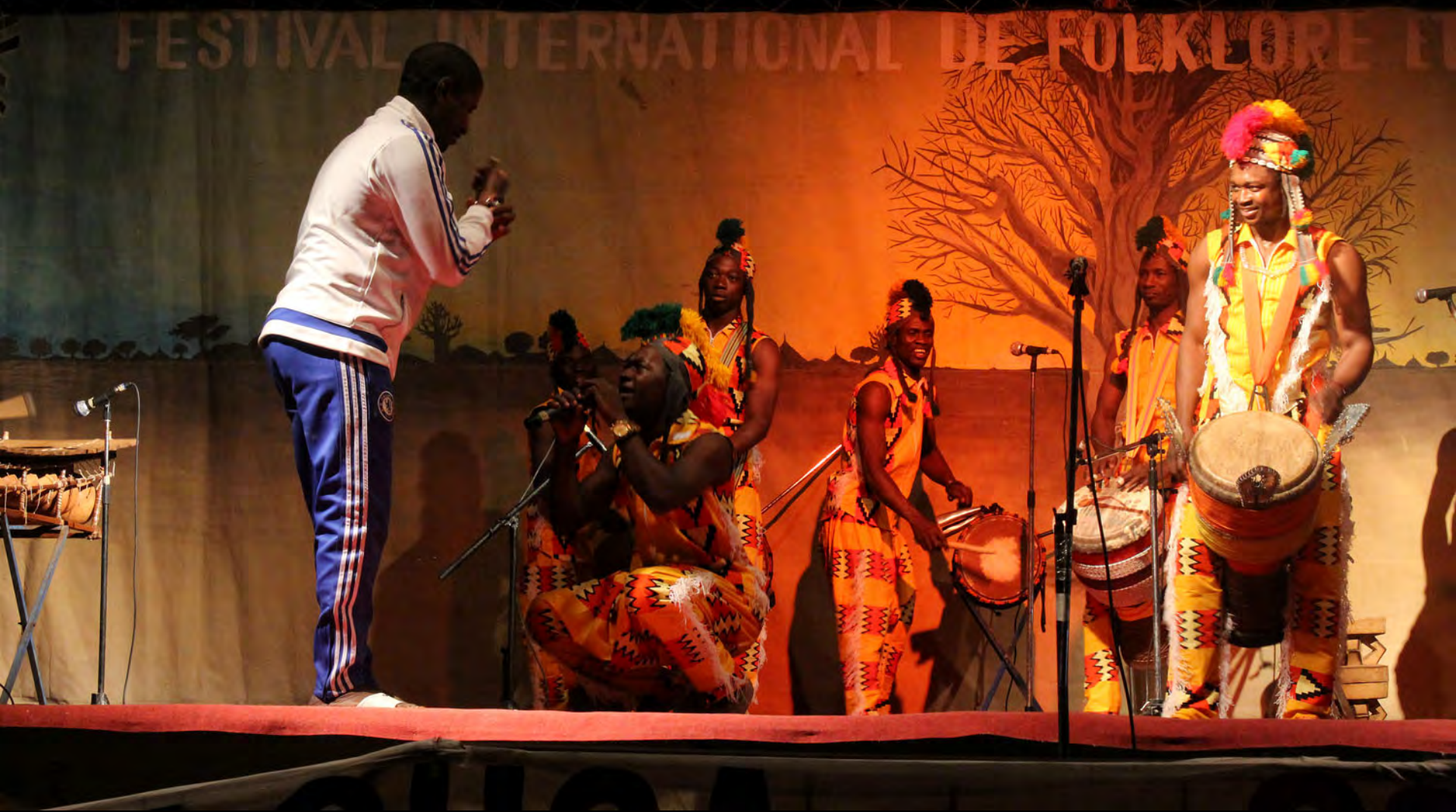
Spontaneous appearance from audience, Mali troupe, 15 th FESFOP, 30 December 2015