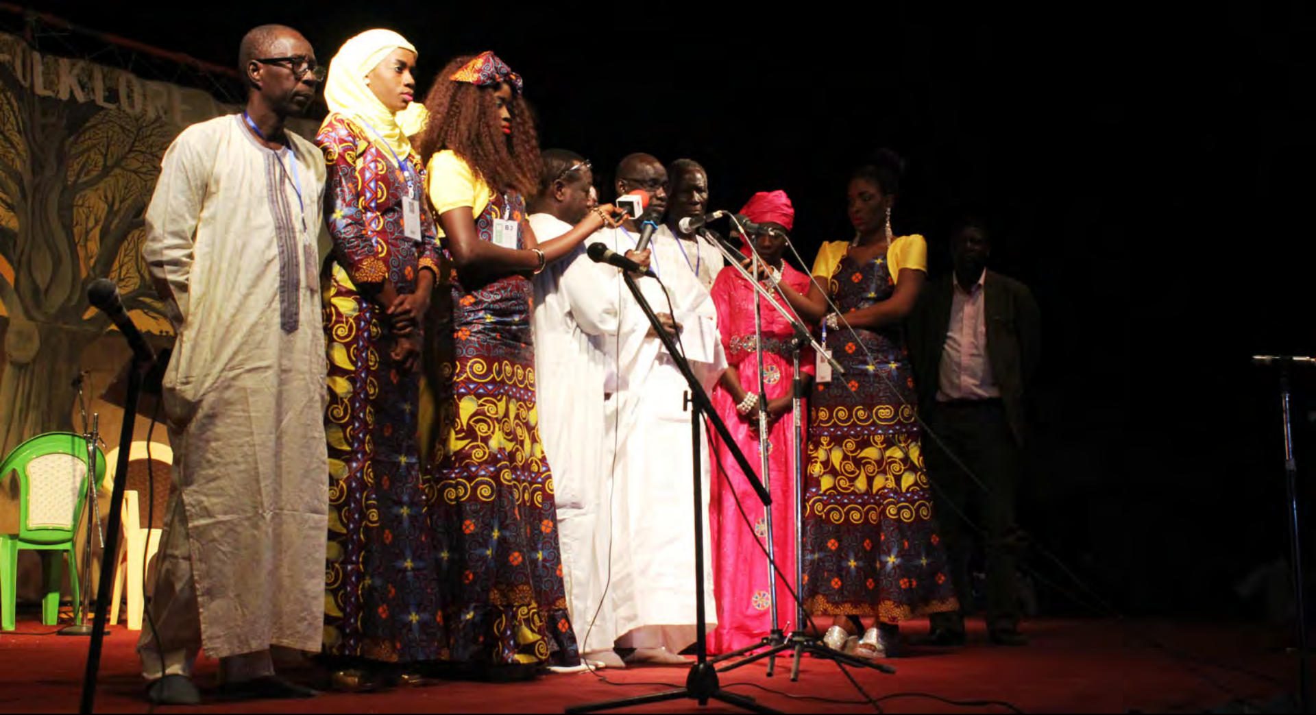
Minister of Culture's speech at opening ceremony 15 th FESFOP, 28 December 2015