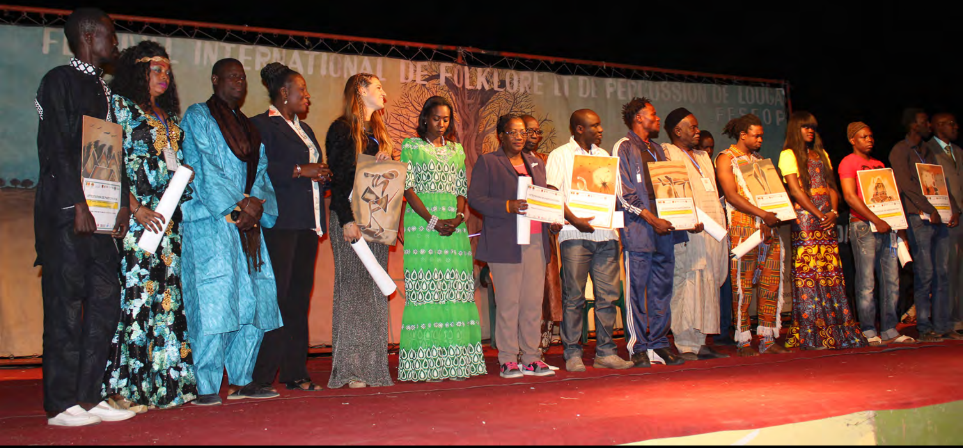
Closing Ceremony 15 th FESFOP, 31 December 2015