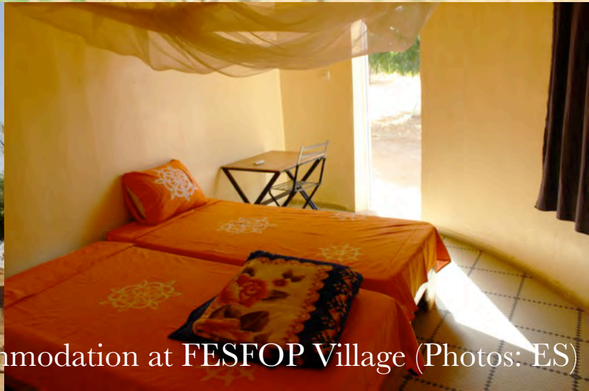
Assane Sylla, responsible for botanic garden, and accommodation at FESFOP Village