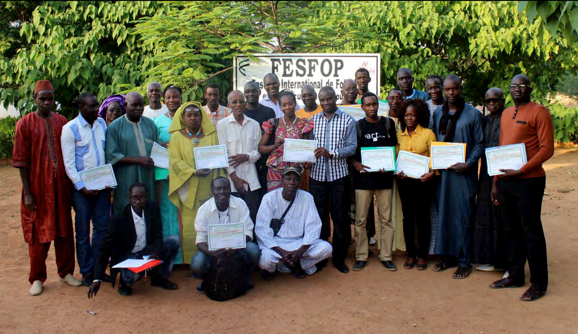
Group photo of FESFOP members who attended the Events Management Workshop. 18 December 2015