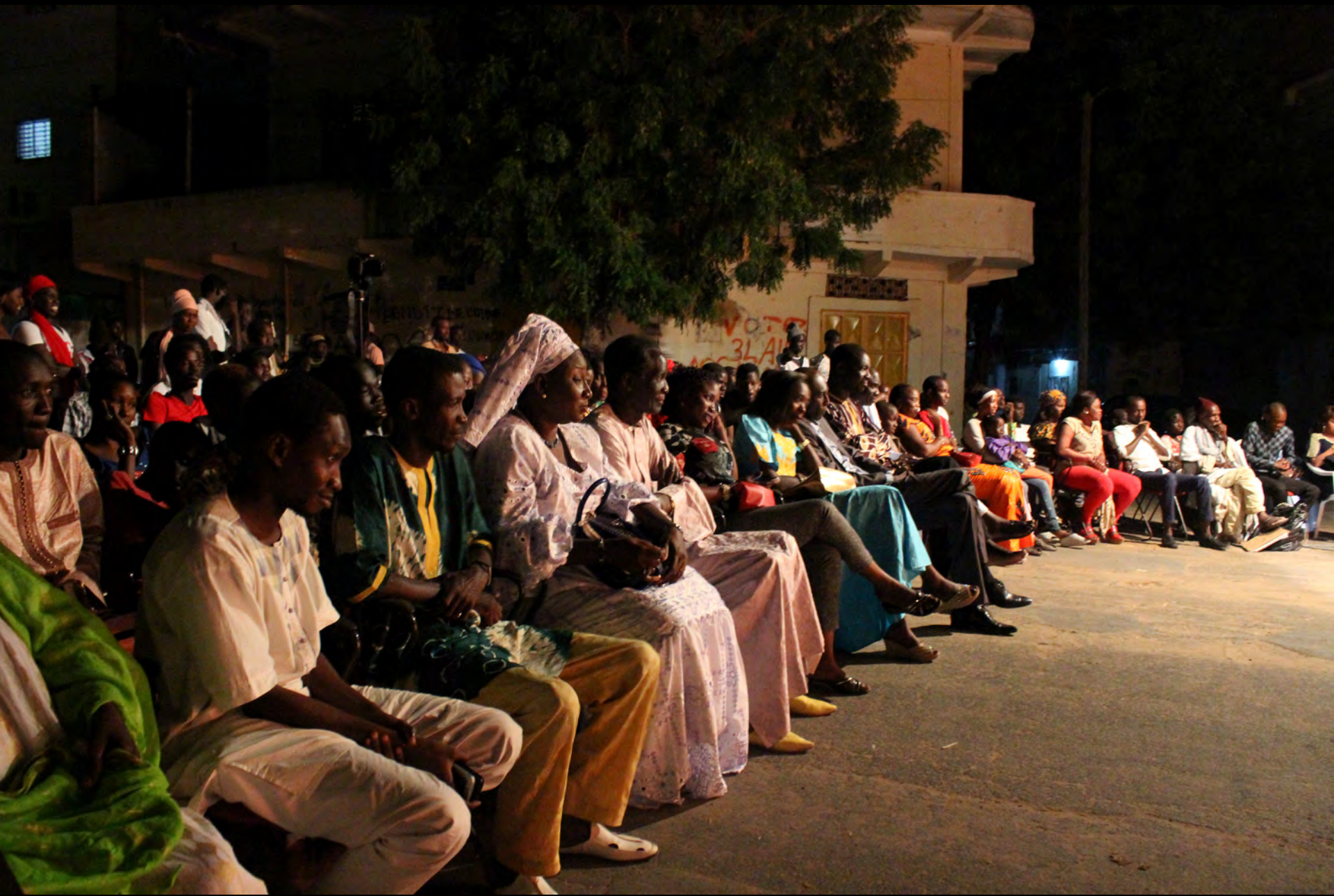
FESFOP members in the first row of audiences at FIRPI, 16 July 2016