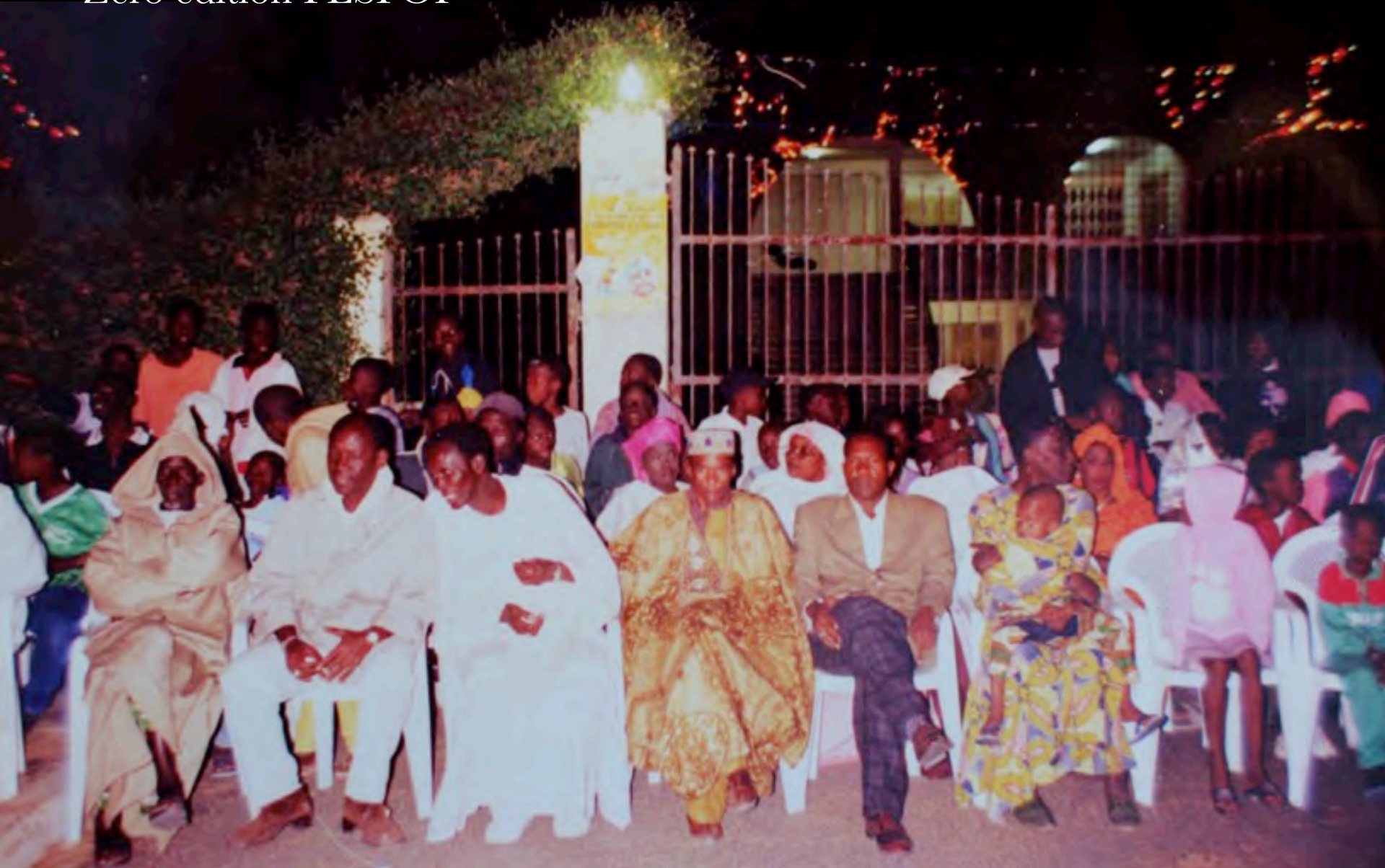
FESFOP Zero Edition, 31 December 1999, in front of the town hall (Photo donated by FESFOP).