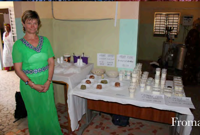
Fromagère Formation, Léona,, 18 December 2015