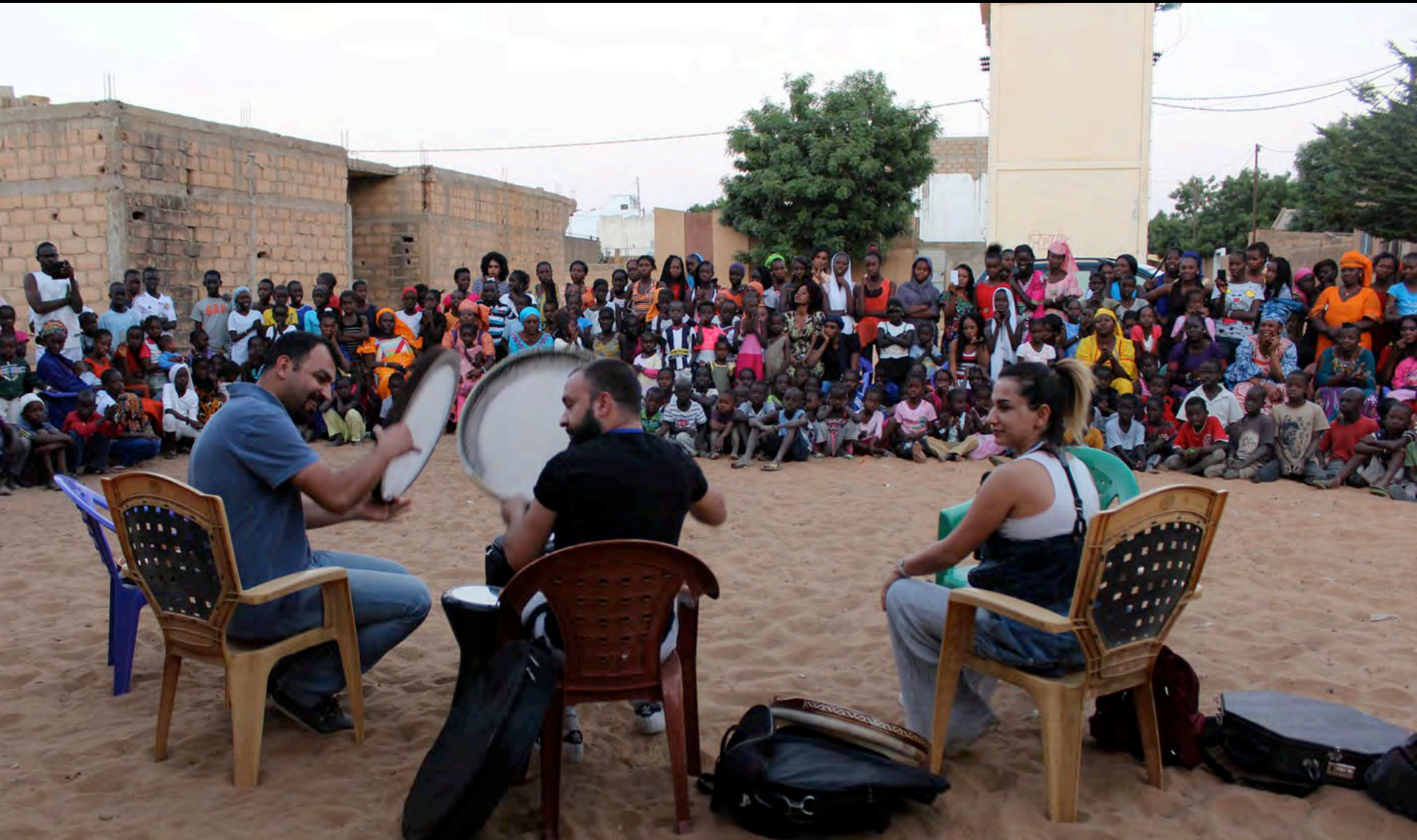
District animation at 15 th FESFOP, 29 December 2015