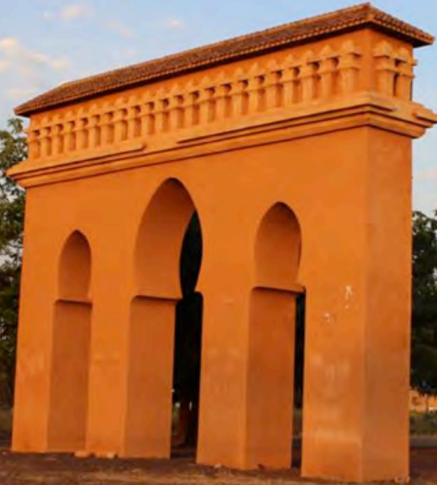
Gate of Louga (Photo: Estrella Sendra, 2015)