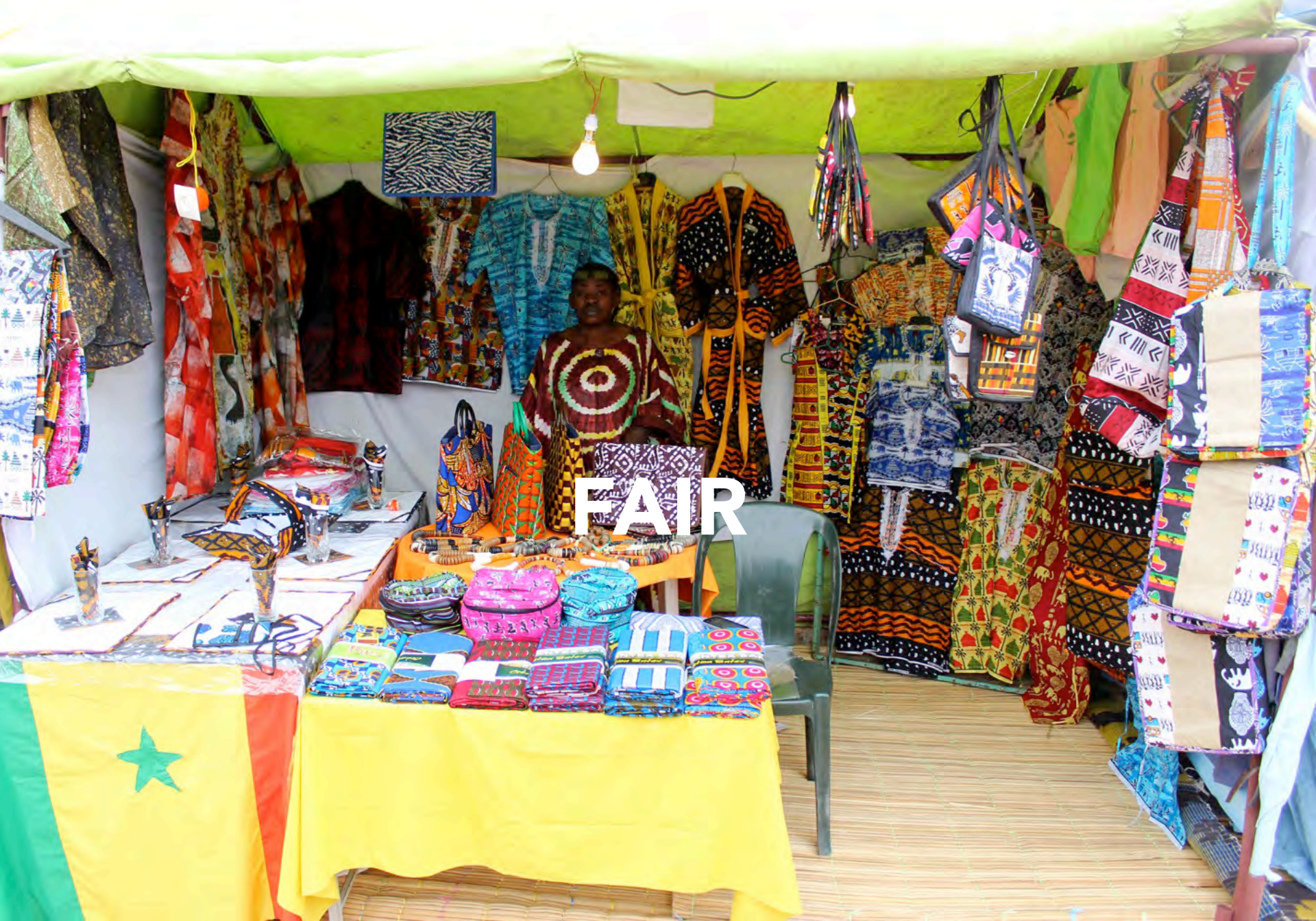
Foire économique régional, 15 th FESFOP, 29 December 2015