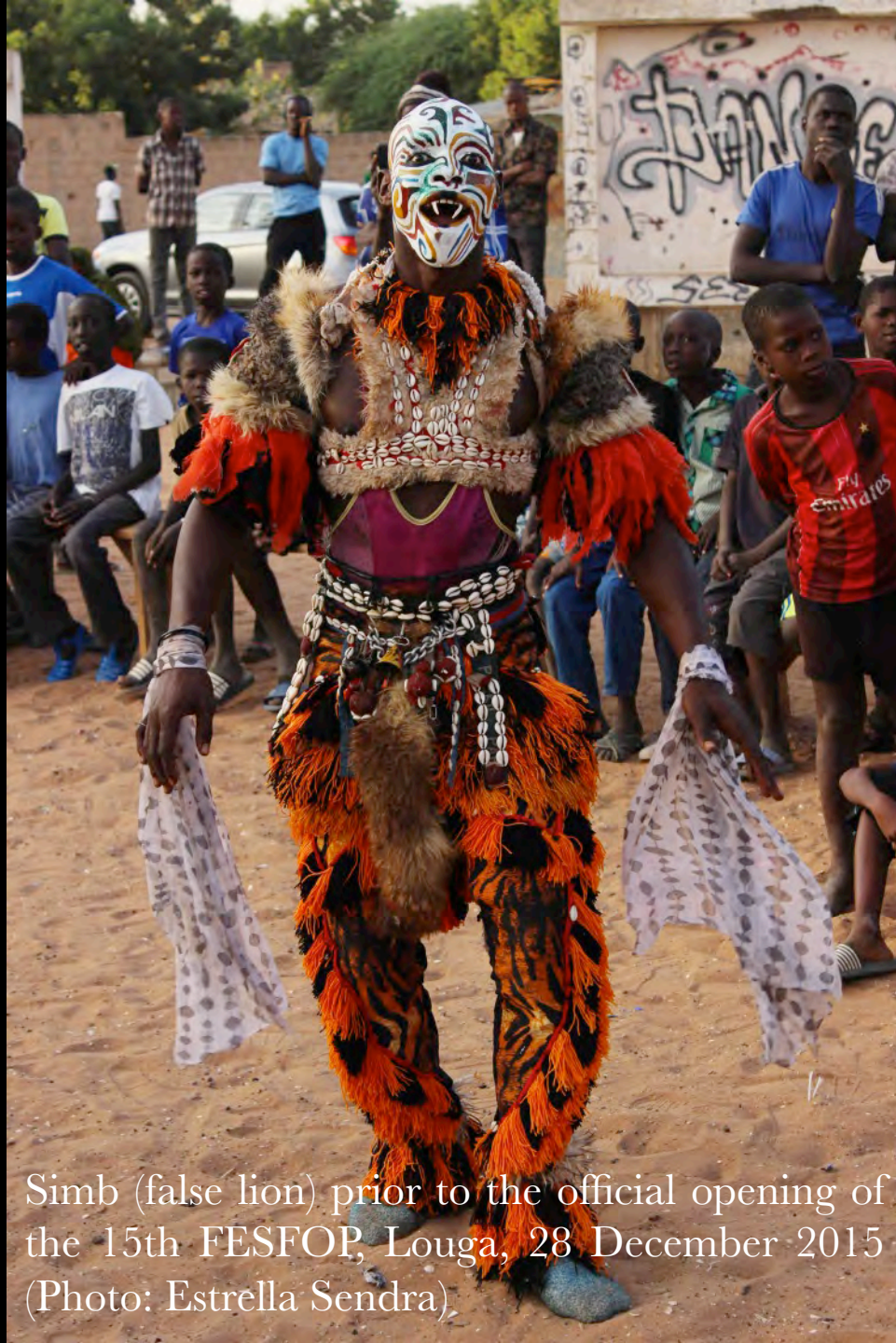
Simb (false lion) prior to the official opening of the 15th FESFOP, Louga, 28 December 2015