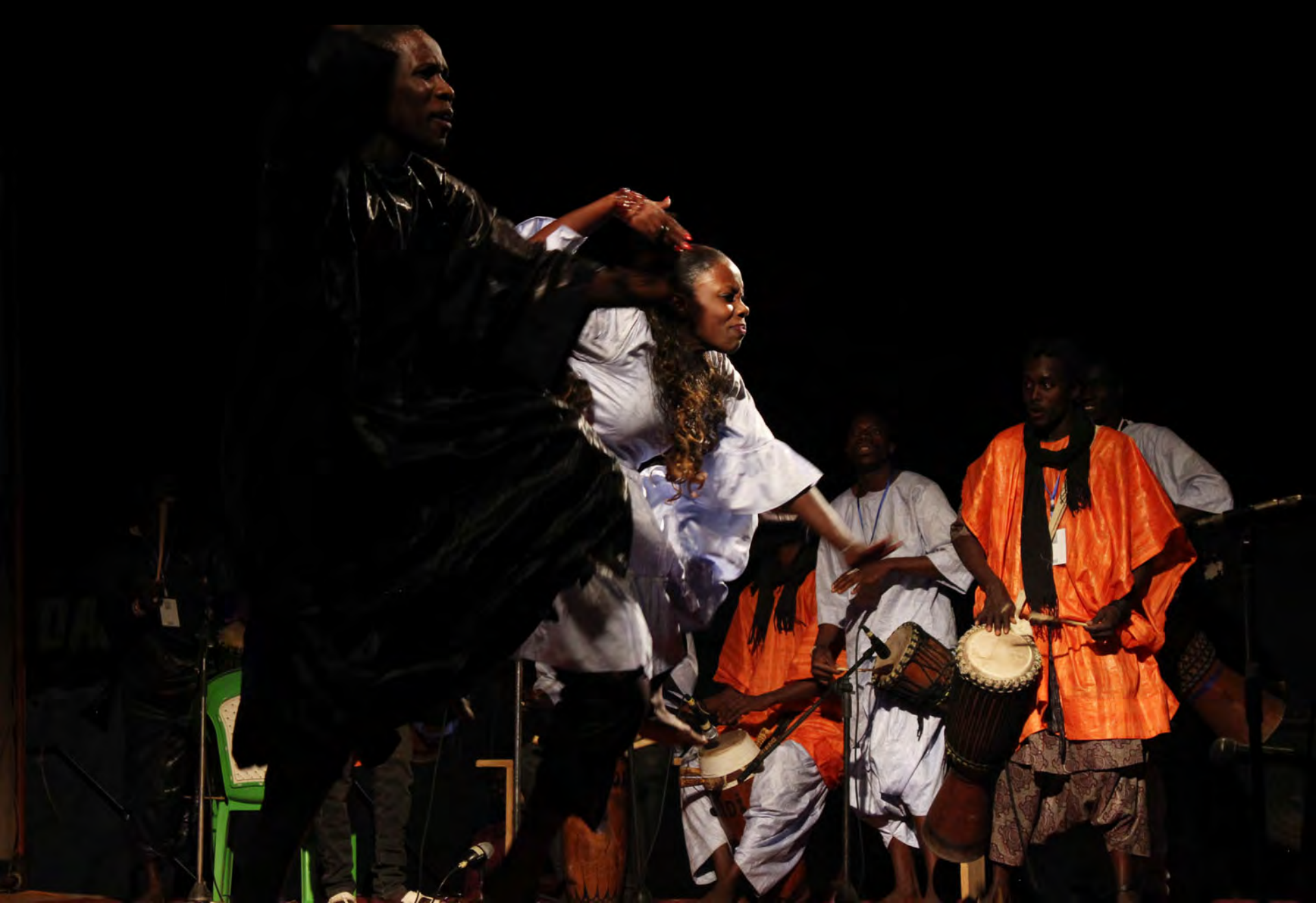
Troupe communale de Louga, Soirée de gala, 15th FESFOP, Louga, 28 December 2015