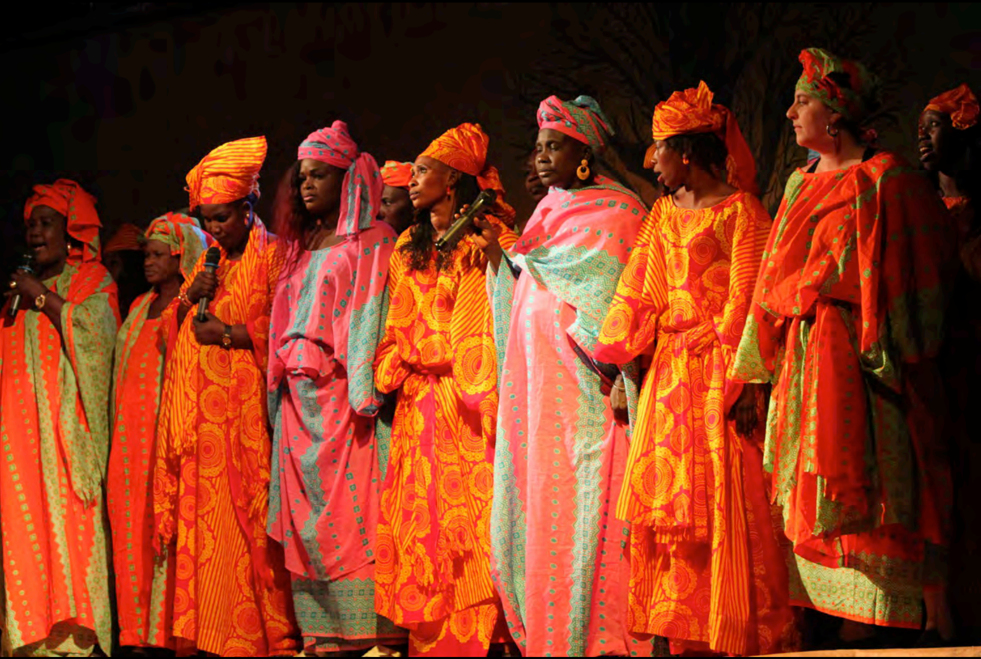
Performance at Sakal, Decentralisation Programme, 19 December 2015