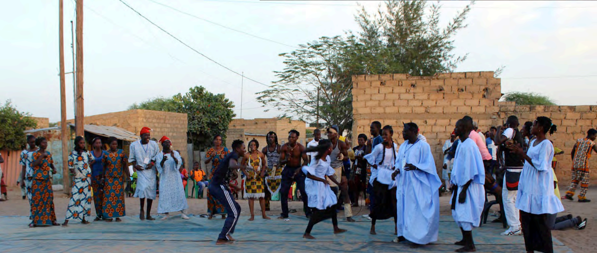
District animations during the 14 th and 15 th FESFOP, 29 December